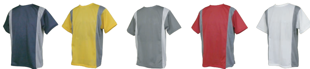
NYV/GRY YEL/GRY GRY/WHT RED/GRY WHT/GRY