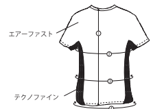
：出来上がりサイズ表：

ストレッチ機能 従来のドライ生地比べ伸びが非常によくスポーツ時の体の運動を妨げず適度な締め付け感によりサポート効果！エアーファストは従来の生地の約1.6倍以上のソフトでスムーズな伸縮性能！