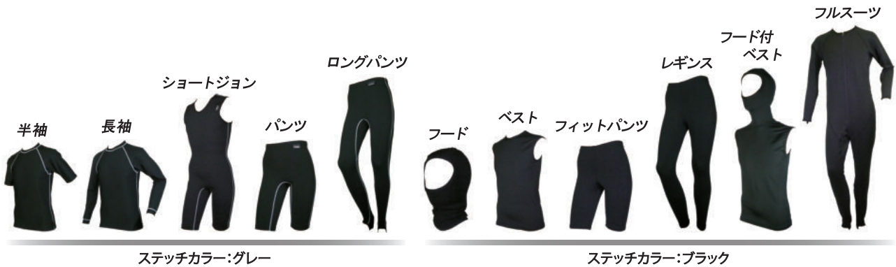
ステッチカラー:グレー